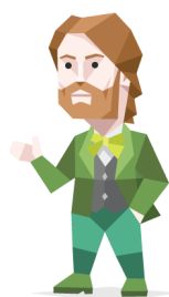
Konstantin Levin Anna Karenina